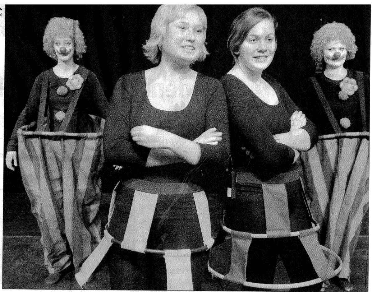
Nielsen Degn.

Vinduer · Tagvinduer · Facadedøre · Indvendige døre · Porte · Trapper - Ring og bestil vores store GRATIS FÆRVEKATALOG!